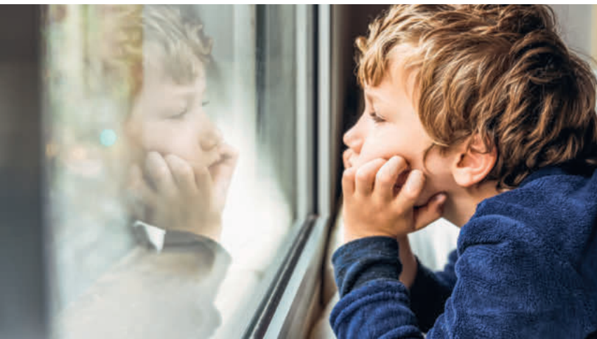
Kinderheime wollen intensivere Begleitung in Krisenzeiten.