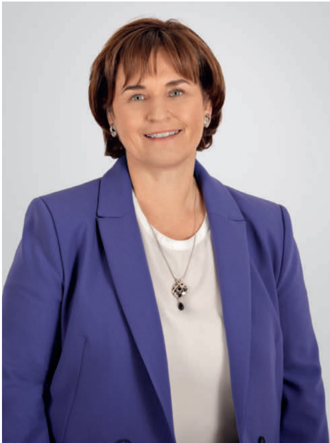
Marina Carobbio, Präsidentin Palliative CH und Tessiner SP-Ständerätin.

«Unheilbar kranke und sterbende Menschen sollen die bestmögliche Begleitung in dem für sie geeigneten Setting erhalten.»