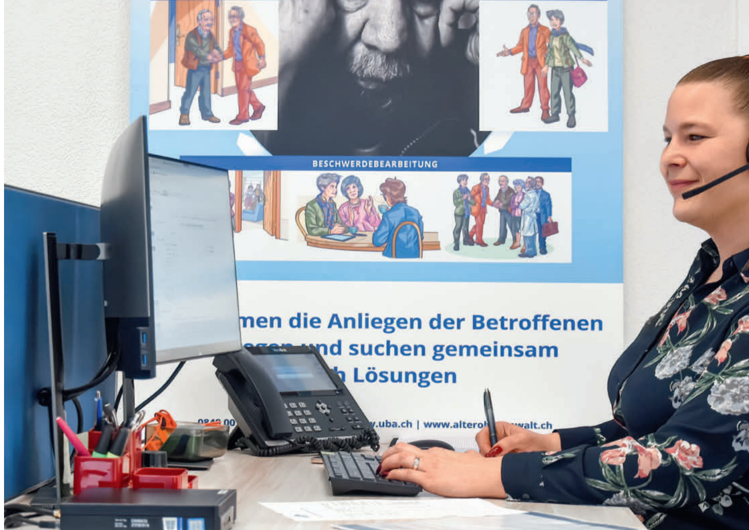
Eine Mitarbeiterin der Geschäftsstelle der Unabhängigen Beschwerdestelle für das Alter UBA in Zürich nimmt Anrufe von direkt oder indirekt involvierten Personen entgegen.