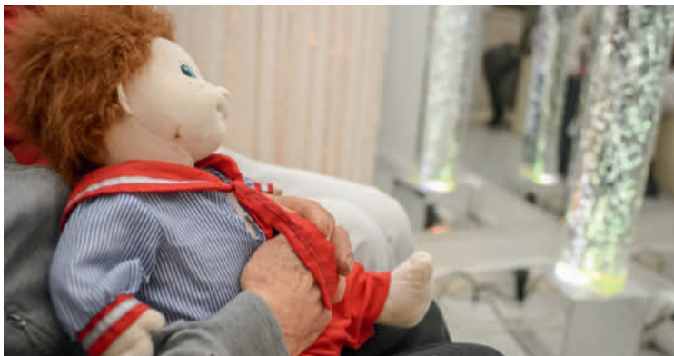
Puppen können eine beruhigende Wirkung haben.

Inklusion: Ende Januar haben Inclusion Handicap und Agile.ch beschlossen, die eidgenössische Inklusionsinitiative mit zu lancieren. Ende April solle die Unterschriftensammlung starten. Angehörige: In der Schweiz gibt es über 50 000 Young Carers. Die Hochschule für Gesundheit Careum hat die Website young-carers.ch lanciert. Junge pflegende Angehörige erzählen ihre Erfahrungen. Lebensgeschichten: Das Netzwerk Erzählcafé Schweiz fördert die Etablierung moderierter Erzählcafés. Demenz: Symptome und Bedürfnisse von Personen mit Demenz bleiben oft unerkannt. Ein Erfassungsinstrument, das im Rahmen der «Seniors-D-Studie» zusammen mit Angehörigen und Pflegenden geprüft wird, solle Abhilfe schaffen. Heimerziehung: Eine Studie untersucht Veränderungen des persönlichen Lebens von jungen Menschen in den stationären Erziehungshilfen. Erste Ergebnisse finden sich auf der Website des Fachverbands Integras.