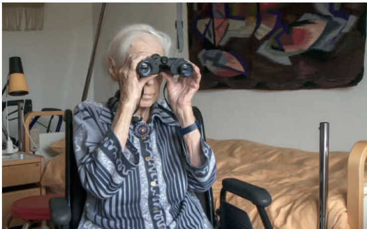
Grossmutter Greti im Film «(Im)mortels»: Zärtliche Annäherung.

Sozialversicherungen: Experten kritisieren, dass invalide Menschen heute oft eine zu tiefe oder gar keine IV-Rente bekommen. Der Grund: Invalidenversicherungen stützten sich bei der Berechnung der IV-Renten auf einen unrealistischen statistischen Wert der Suva. Verdingkinder: Da viele ehemalige Verdingkinder fürchten, im Alter wieder in institutionelle Abhängigkeit zu geraten, sollen Betroffene zu «Caregivers» ausgebildet werden. Sie sollen anderen ehemaligen Verdingkindern im Alter helfen und sie begleiten. Pflege: Der Schaffhauser Kantonsrat hat ohne Gegenstimme die Regierung verpflichtet, mit Wieder- und Quereinstiegsmodellen dem Pflegenotstand entgegenzuwirken. Pflege II: Der Telemedizinanbieter Santé24 und Spitex Zürich testen gemeinsam eine neue Art der integrierten Versorgung: Für «Home Tele Care» arbeiten Ärzte eng mit Pflegeexpertinnen APN zusammen, die ihre Patienten vor Ort betreuen.