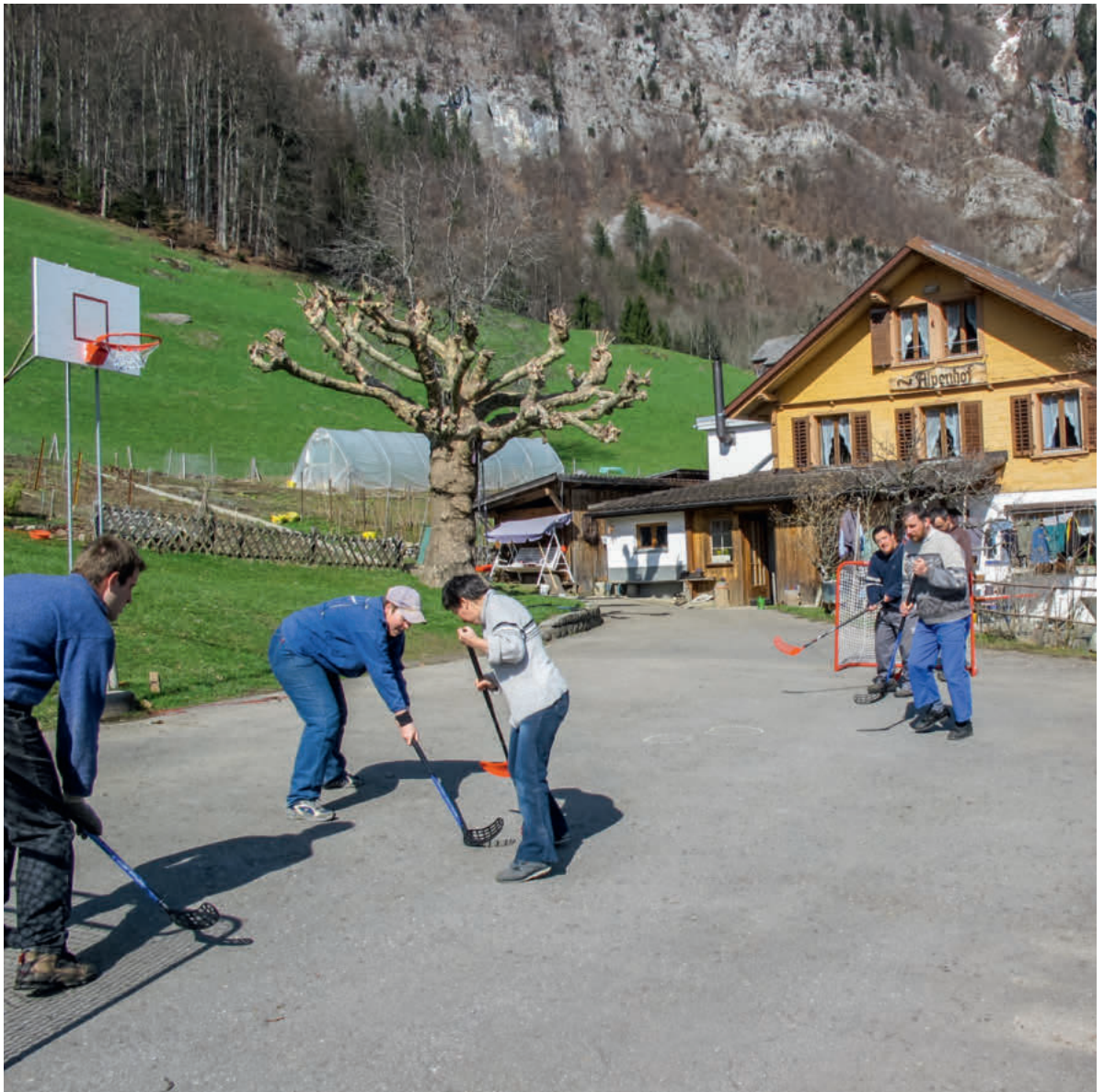
Hockeymatch vor dem Alpenhof in Walenstadtberg: Weit weg von den Zentren – für Menschen, die gerne naturnah leben.

keiten. Das ist in einem Betrieb ist ersten Arbeitsmarkt oft nicht möglich.»