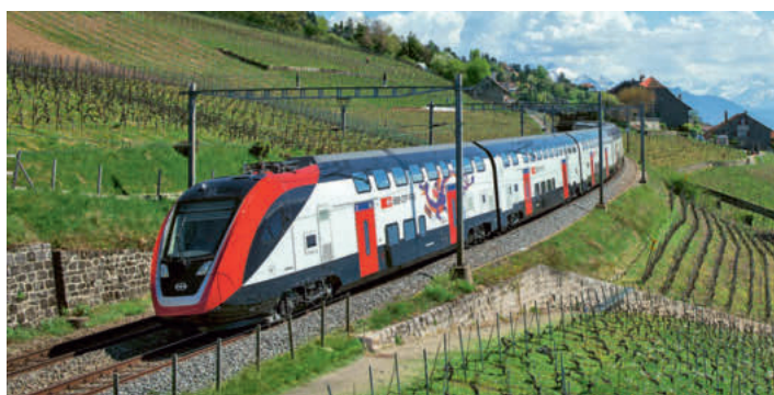
SBB-Zug FV-Dosto: Abklären, ob Ein- und Ausstieg für mobilitätsbehinderte Menschen autonom möglich ist.

Nach der Kritik der Organisation Inclusion Handicap müssen die SBB sicherstellen, dass alle Rampen im Ein- und Ausstiegsbereich der neuen Fernverkehrs-Doppelstockzüge (FV-Dosto) eine maximale Neigung von 15 Prozent aufweisen. Das hat das Bundesgericht entschieden. Darüber hinaus müsse das Bundesamt für Verkehr (BAV) abklären, ob der Ein- und Ausstieg von mobilitätsbehinderten Menschen mit Bezug auf die Abfolge der beanstandeten Gestaltungselemente insgesamt autonom und sicher genutzt werden könne. Die FV-Dosto sind seit rund vier Jahren auf dem Schweizer Schienennetz im Einsatz.