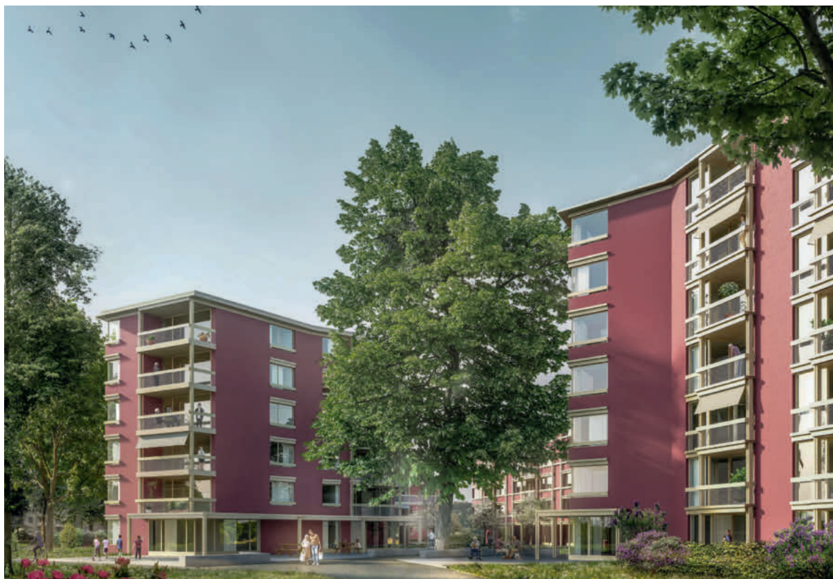
Siedlung Espenhof Nord in Zürich: So werden die Häuser aussehen, in denen 2025 unter anderem auch Wohneinheiten und Pflegeplätze für queere Menschen Platz finden.

jeder Mensch, unabhängig von seiner sexuellen Orientierung und/oder Geschlechtsidentität, mit seinem Lebensgepäck kommen darf und akzeptiert wird.» Viele LGBTIQ-Menschen fühlten sich in gemischten Gruppen weniger wohl und möchten nicht noch mal «zurück in den Schrank», sondern sich lieber unter ihresgleichen bewegen.