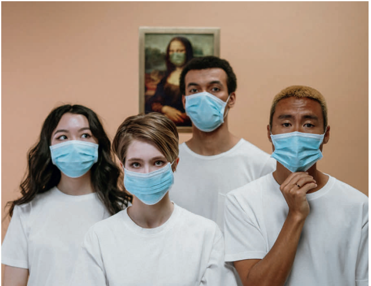
Diverses Pflegeteam: In den Alters- und Pflegeheimen ist die Diversität des Personals heute eine Tatsache.

beobachten. Dies ist im Zusammenhang mit gesellschaftlichen und gesundheitspolitischen Entwicklungen zu sehen, die dazu führen, dass zunehmend mehr Klientinnen und Klienten der Alters- und Pflegeheime nicht dem «klassischen» Bild einer Pflegeheimbewohnerin oder eines Pflegeheimbewohners entsprechen.»