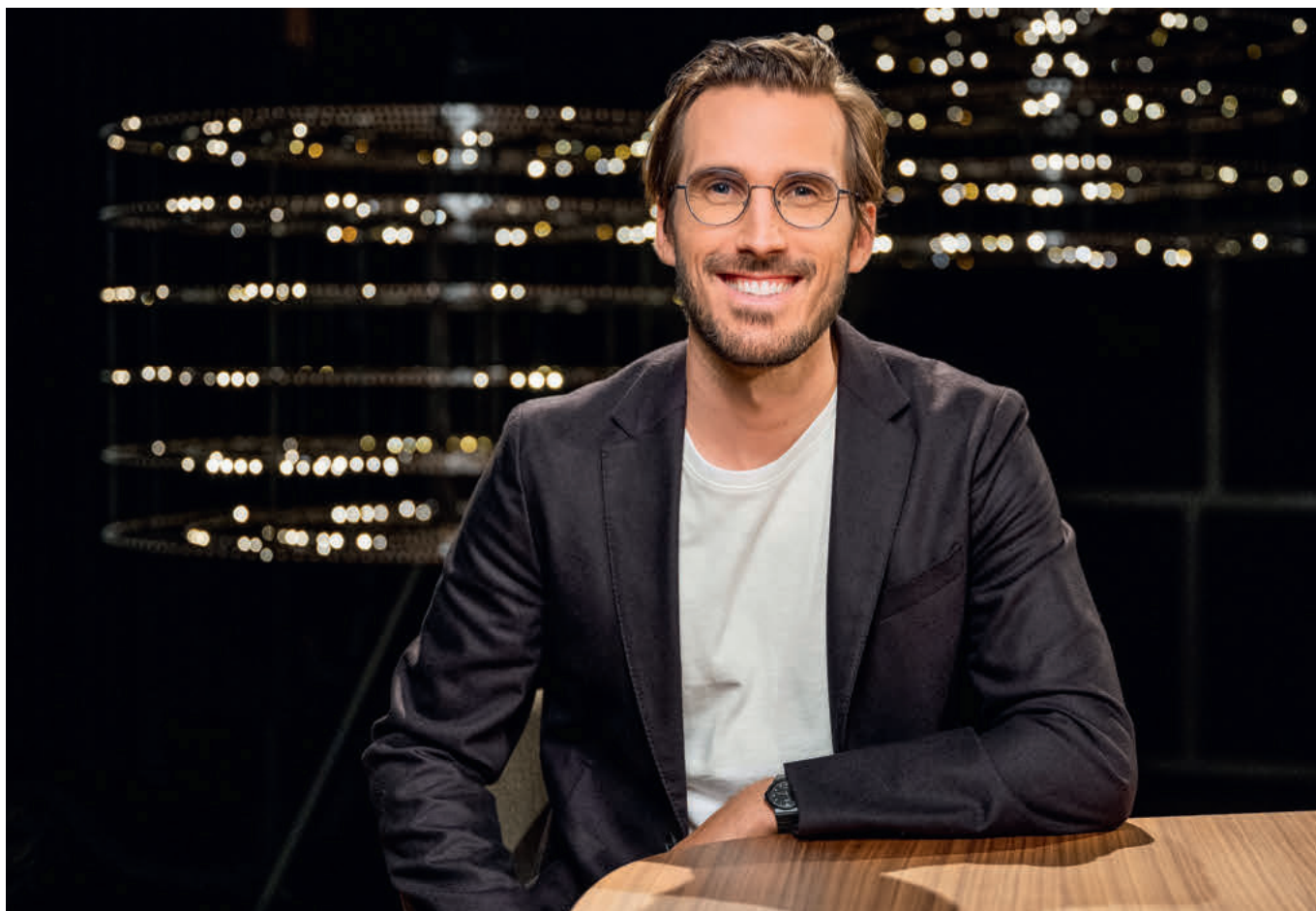
Yves Bossart, Philosoph und Moderator der Sendung «Sternstunde Philosophie» auf SRF: «Wir leben in einer Illusion von Kontrolle.»

macht, dass Veränderung der Normalzustand ist. Zudem: Als Führungsperson hat man mit Menschen zu tun, mit ganz unterschiedlichen Menschen, wobei jeder Mensch in sich widersprüchlich ist. Solche Widersprüche muss man aushalten können, einen gewissen Pragmatismus entwickeln, Kompromisse finden.