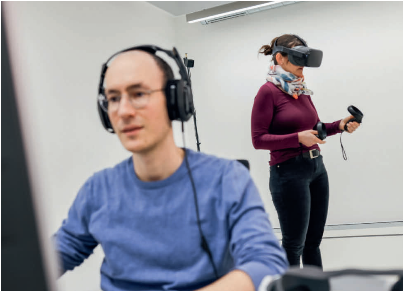
Virtuelles Training für Gesundheitsberufe: Flexibler, unterhaltsamer und dennoch lehrreicher Unterricht.

des Bachelors für Diätetik in Dreiergruppen an einem Rollenspiel teilgenommen. Eine Person wurde jeweils der Rolle der Ernährungsberaterin zugeteilt, eine Person übernahm die Rolle der Patientin, eine dritte Person beobachtete und gab Feedback. Die Gespräche fanden mittels VR-Headsets in einem virtuellen Spitalzimmer statt. Bei der anschließenden Befragung schnitt die Gebrauchstauglichkeit der Anwendung gut ab. Die realistische Lernumgebung und die Praxisnähe wurden positiv hervorgehoben.