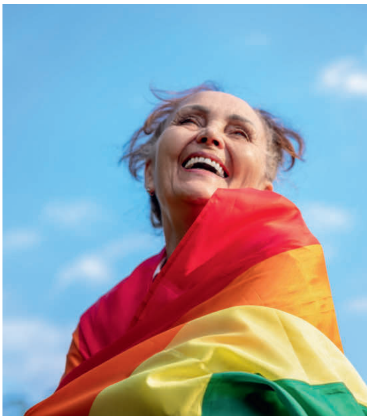
Freie Vielfalt: Queere Menschen wollen sich auch im Alter nicht verstecken müssen, sondern angenommen werden, wie sie sind.

Zum anderen entscheiden sich die künftigen Bewohnerinnen und Bewohner bewusst dafür, den Lebensabend unter ihresgleichen zu verbringen: «Queere Menschen haben andere Biografien und viele andere Lebensthemen als die heteronormative Mehrheitsgesellschaft.»